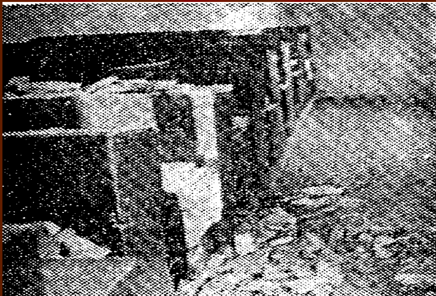
Učebna ve staré škole se spadlou omítkou stropu v roce 1931

Když se zjistilo, že stará škola je opravdu v hodně špatném stavu, přicházela nutně v úvahu novostavba. Nové místo pro školu bylo vybráno kousek vlevo od ulice Husovy do dnešní ulice Jiráskova.