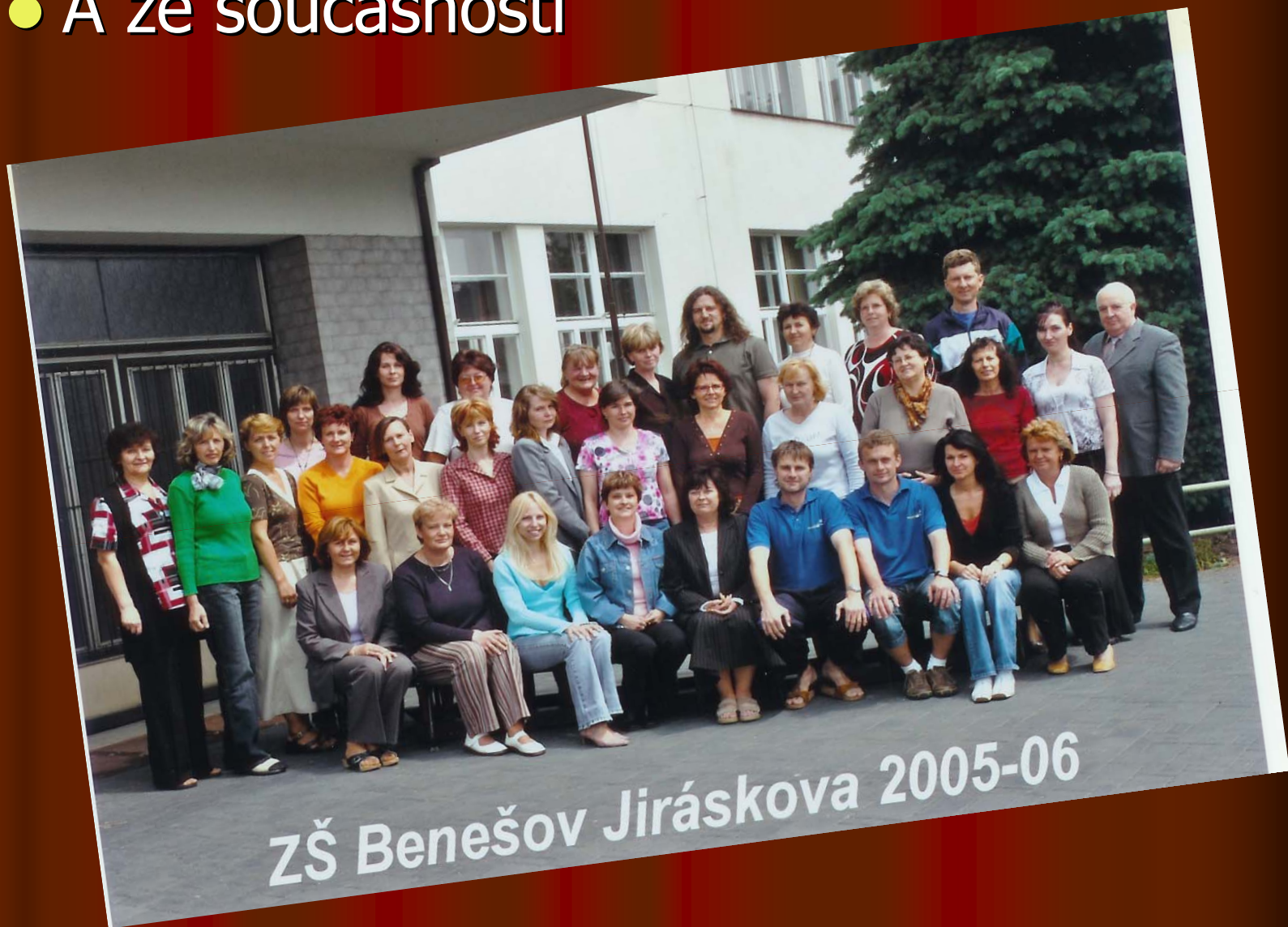
ZŠ Benešov Jiráskova 2005-06